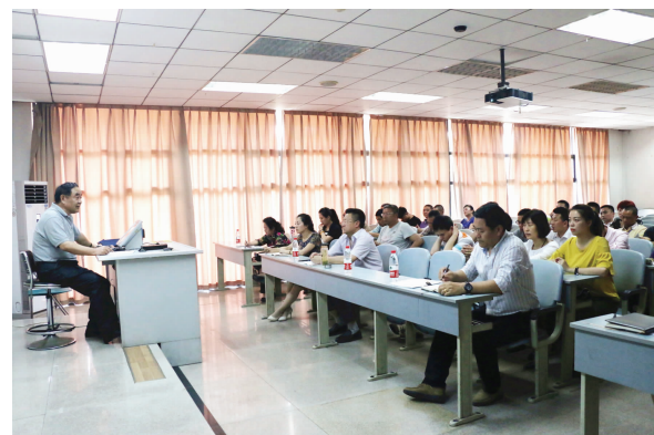
后勤员工认真学习“两学一做”内容精神

吴教授围绕“四讲四有”这根主线,深入浅出,结合德国化学专家曼弗雷德·布罗克自1996年起三度申请入党等典型事例,做了生动、切合实际的讲解。一是讲政治,有信心。讲政治是对共产党员第一位的要求,坚定共产主义信仰,努力把坚定的理想信念转化为修身做人、干事创业、全心全意为人民服务的具体行动。带领大家重温学习了共产党员八项基本义务。二是讲规矩,有纪律。严格执行党章党规党纪,模范遵守国家法律法规,遵守政治纪律、群众纪律、工作纪律。重点对《中国共产党纪律处分条例》第六章第四十五条内容做了解析与指导。三是讲道德,有品行。树立崇高的理想追求,守住为人处事的底线,吸取反面案例时刻警示自己,让自己的思想行动符合共产党员的标准。四是讲奉献,有作为。共产党员的先锋模范作用来自于舍己为公的奉献精神,必须一心为公、一心为党、一心为民。