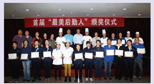
首届“最美后勤人”颁奖仪式

雄关漫道真如铁,而今迈步从头越。本屆“最美后勤人”投票评选活动的顺利开展是集团树立良好后勤形象,弘扬后勤正能量,促进后勤与师生之间互动交流的新形式。在“五一”国际劳动节致辞中,集团马永正总经理提出两点希望:一是希望所有受表彰的后勤人珍惜荣誉,戒骄戒躁,再接再厉,继续发挥骨干、先锋和表率作用;二是希望广大后勤员工向本届“最美后勤人”学习,对比标杆,锤炼自我,勇于创新,在今后的服务保障工作中赢得更多师生的认可、肯定。劳动光荣创造伟大,平凡岗位出彩人生。相信在“最美后勤人”这一旗帜的引领下,集团各部门的服务岗位上将会涌现出越来越多的后勤标兵、先进,我们的后勤将会办的越来越好,师生的幸福获得感也将越来越多。