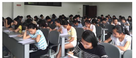
后勤勤工助学考核现场

集团各部门根据工作实际设立了包括宣传联络员、浴室监督管理员、餐饮服务信息员、公寓巡视员、食品安全监督员、公共卫生安全监督员、校园环境和商铺物业监督员八个岗位,覆盖面更广,参与人数更多,经过前期自主报名、学院推荐、报名表审核程序后的学子顺利进入考核。岗位全部采取公开招聘、双向选择、竞争上岗的方式,通过逐一面试和笔试考核的形式进行,考核内容贴近各个岗位工作实际,录用名单于6月1日前在集团官方网站“通知公告”一栏进行公示。