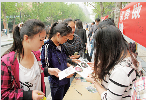
过往同学认识校园植物

通过此次活动,给校园里的各种树木一张“身份证”,替这些“沉默的朋友”作了一下自我介绍,让更多的同学有机会认识、了解身边的植物,激发了同学们关注植物、热爱植物的乐趣,从而达到宣传植物知识、保护植物、保护环境的目的,让同学们在潜移默化中爱护绿色、传播绿色,保护校园。